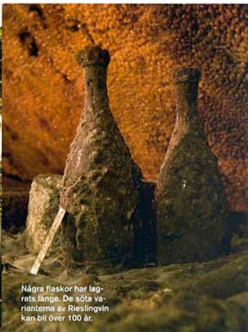
Några flaskor har lagrats länge. De söta varianterna av Rieslingvin kan bli över 100 år.