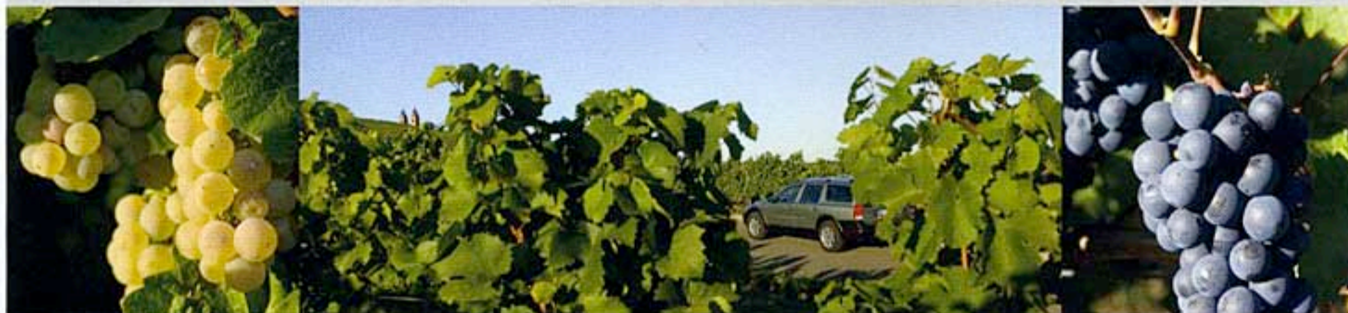
Riesling och Spätburgunder – två druvsorter som är populära i Tyskland.