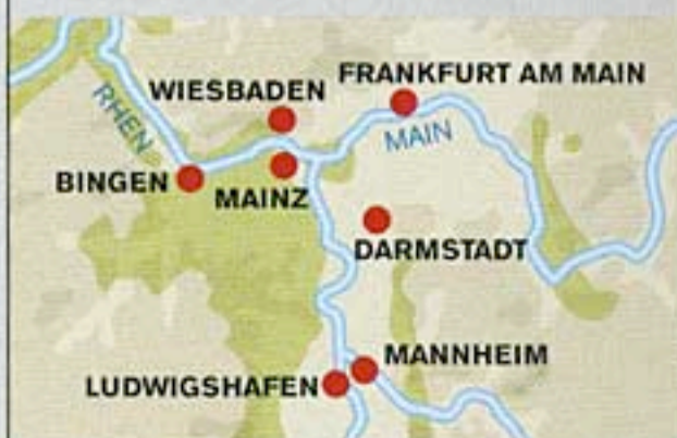
Området med vinodlingar som vi besökte.

Det finns 13 vindistrikt i Tyskland. Odlingsarealen ligger kring 100 000 hektar. Det är jämförbart med Bordeaux i Frankrike. Det finns 16 000 tyska vinproducenter. 70 procent av arealen används