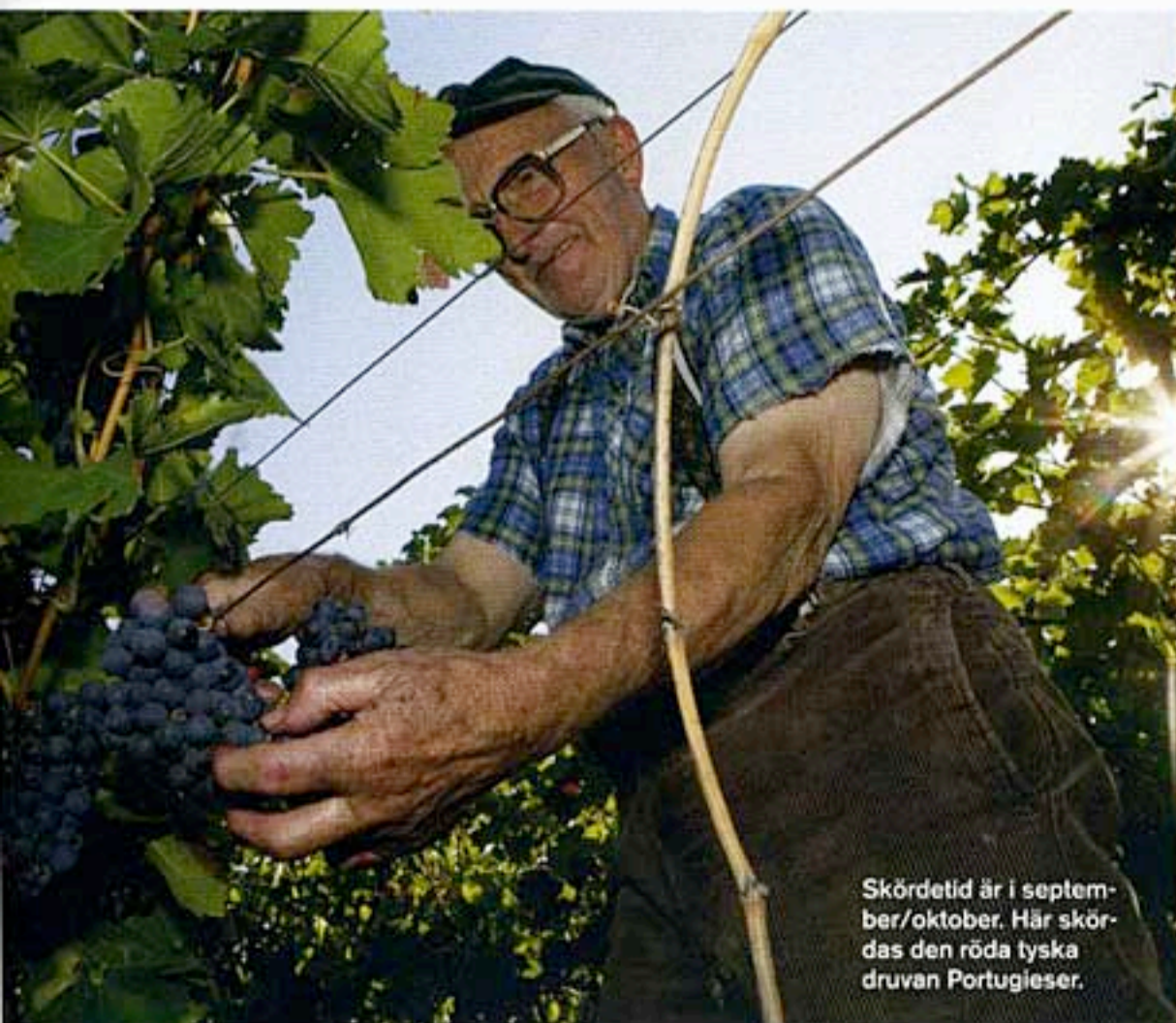
Skördetid är i september/oktober. Här skördas den röda tyska druvan Portugieser.

En annan del av traditionen är benediktinerklostret Abtei St. Hildegard, vackert beläget ovanför Rüdesheim. Genom århundradena har klostren varit med och bidragit till utvecklingen av vinmakandet. Abtei St. Hildegard odlar vin på 6,5 hektar och producerar 50 000 flaskor årligen – mest Riesling och en liten del Spätburgunder. Klostret exporterar en del – hälften av försäljningen sker via Internet och hälften i den egna butiken.